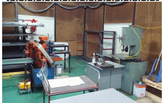
材料棚、バンドソー、コンターマシン、CO2溶接機等