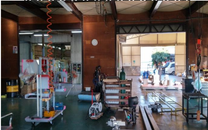
製缶/加工場より塗装場/組立工場/出荷工場の風景