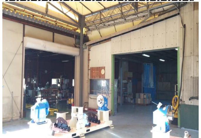
出荷工場からの製缶/加工場/塗装場の風景